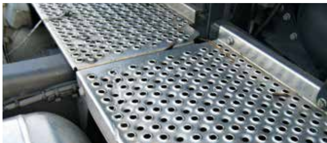
✓ Frameafdekking/Teken en van slijtage • Lichte vervorming, lichte krassen

Voorbeelden van schade aan afdekplaat chassis, onderrijbeveiligingen en spatborden.