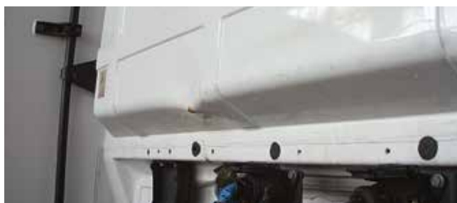
✗ Achterwand cabine/Substantiële schade • Deuken, lakschaafplekken of barsten