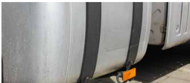
✓ Brandstoftank/Teken en van slijtage • Krassen