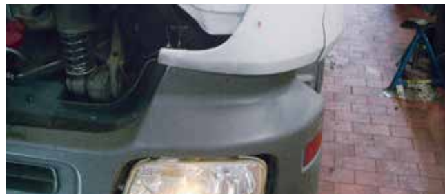
✗ Windgeleider/Substantiële schade • Krassen, scheuren of materiaalbreuk