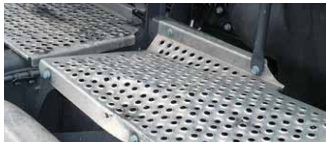
✗ Frameafdekking/Substantiële schade • Grote vervormingen