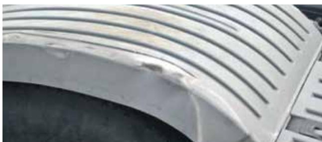
✓ Wielkast/Teken en van slijtage • Lichte krassen en deuken