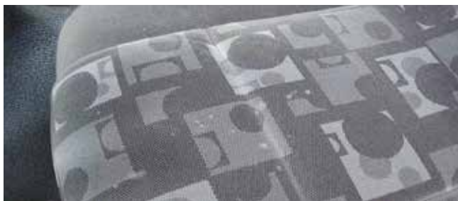
✓ Stoelen/Teken en van slijtage • Vlekken