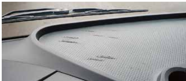
✗ Dashboard/Substantiële schade • Diepe krassen, gaten of geboorde gaten