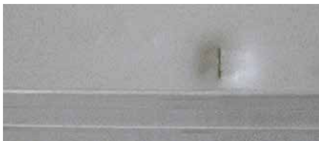
✗ Carrosserie interieur/Substantiële schade • Diepe deuken met barsten of perforaties in de isolatie van de laadbak