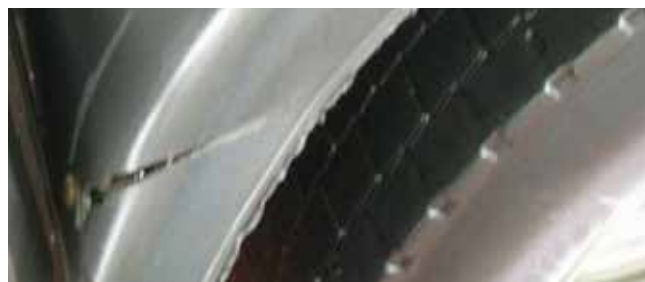
✗ Spatbord/Substantiële schade • Krassen, barsten of materiaalbreuk