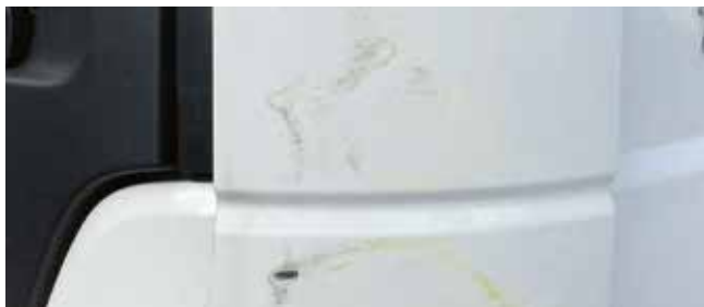
✓ Windgeleider/Teken en van slijtage • Lichte slijtage

Voorbeelden van schade aan windgeleider, luchtgeleider en zijbeschermingspaneel.