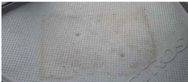
✓ Dashboard/Teken en van slijtage • Kleine gaatjes, vervuiling

Voorbeelden van schade aan dashboard, stoelen en brandstoftank.