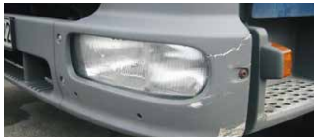
✗ Bumper/Substantiële schade • Ernstige krassen, barsten of materiaalbreuk