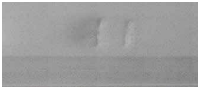
✓ Carrosserie interieur/Teken en van slijtage • Kleine deukjes zonder barsten