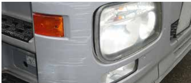
✓ Bumper/Teken en van slijtage • Lichte slijtplekken

Voorbeelden van schade aan bumpers, wielkasten en instaptreden.