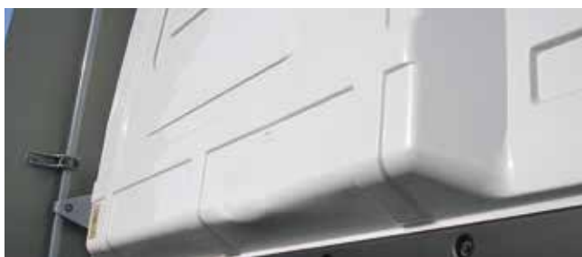
✓ Achterwand cabine/Teken en van slijtage • Lichte krassen, kleine deuken of wrijving