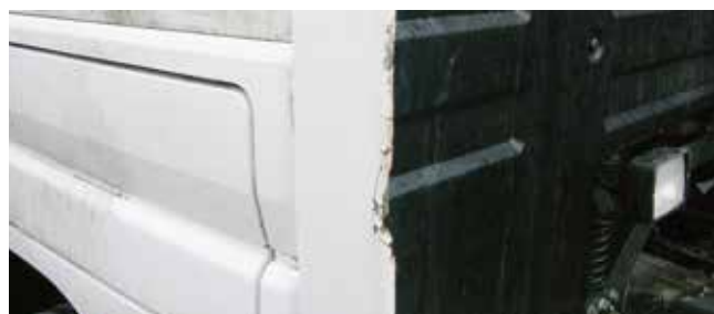
✗ Luchtgeleider/Substantiële schade • Krassen, barsten of materiaalbreuk