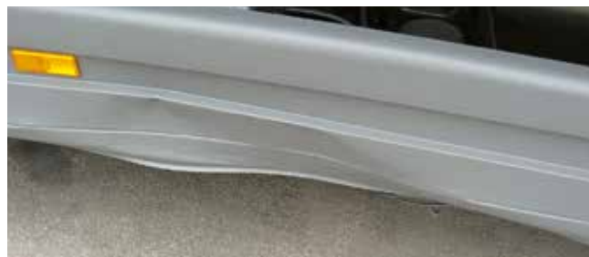
✗ Onderrijbeveiliging/Substantiële schade • Grote vervormingen