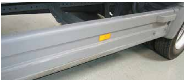
✓ Onderrijbeveiliging/Teken en van slijtage • Lichte slijtage