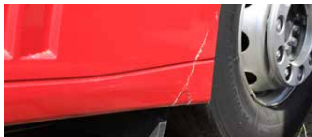
✗ Sierstrips zijbeschermingspaneel/ Substantiële schade • Krassen, barsten of materiaalbreuk