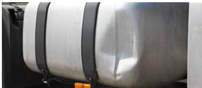
✗ Brandstoftank/Substantiële schade • Vervormingen