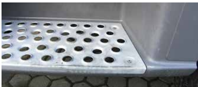
✓ Instaptrede/Teken en van slijtage • Lichte slijtage