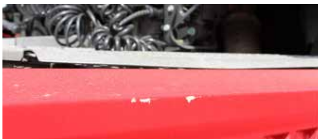
✓ Sierstrips zijbeschermingspaneel/ Teken en van slijtage • Lichte slijtage