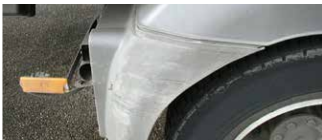
✓ Spatbord/Teken en van slijtage • Lichte krassen op het oppervlak