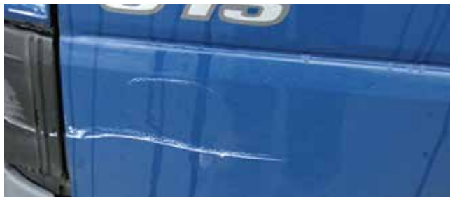
✗ Deur/Substantiële schade • Ernstige lakschade