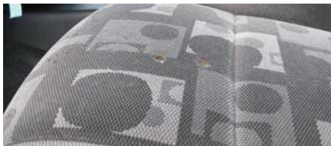
✗ Stoelen/Substantiële schade • Gaten of scheuren