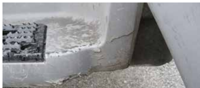
✗ Instaptrede/Substantiële schade • Diepe krassen, ontbrekend materiaal of barsten