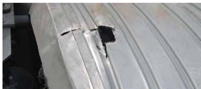
✗ Wielkast/Substantiële schade • Gat en vervormingen